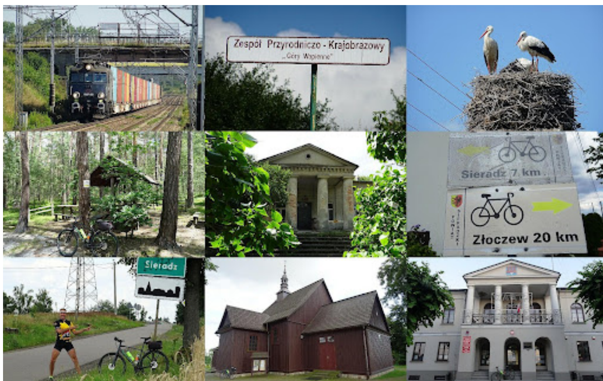
Zdjęcia ze szlaku „Sieradzkiej E-ski”.

W celu stworzenia mechanizmu współpracy w zakresie zarządzania dziedzictwem kulturowym należy nawiązać współpracę z innymi miejscowościami leżącymi na dawnej ziemi sieradzkiej oraz obiektami zabytkowych dworków w celu tworzenia wspólnych inicjatyw szlaku ułatwiającego zwiedzanie tych miejsc m.in. na trasie „Sieradzkiej E-ski”.